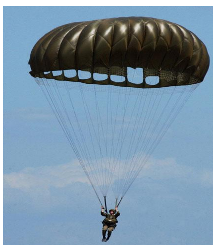
・丸型パラシュート